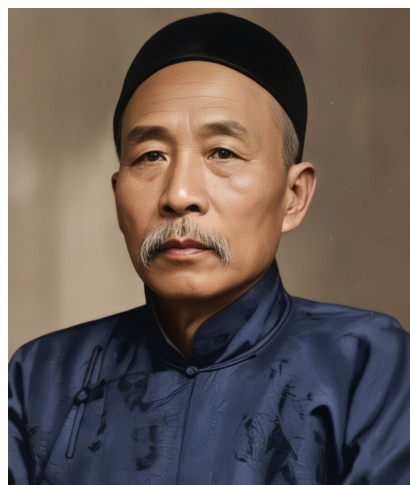
Grafika. 6-8. Od lewej, generał Liu Yong Fu, znak chiński Ling (令) umieszczany na flagach „Armi Czarnej Flagi”, oraz prezydent Republiki Formozy generał Tang Jing Song

Za dynastii Qing pracował jeszcze w jej administracji. Uchodził za skutecznego pogromcę uzbrojonych grup, oraz mediatora w konfliktach klanowych, które stanowiły zmorę południowo-chińskiej społeczności tamtych czasów. Przeżył dynastię Qing, która upadła w 1912 roku w wyniku krótkotrwałej Rewolucji Xinhai (辛亥革命) i w okres Republiki Chińskiej wszedł już jako emeryt. Żył wspomnieniami, które potem zostały spisane.