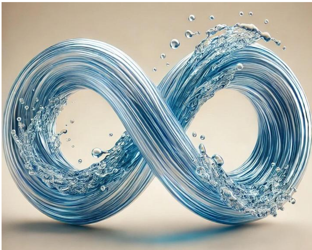
Znak nieskończoności.

W chińskiej kulturze ważną rolę odgrywają symbole. Mają one swoje historyczne źródło wynikające z taoizmu i myślenia magicznego. To właśnie one sprawiają, że specjalne znaczenie zyskują zwierzęta, kolory i liczby. Charakterystyczne symbole towarzyszą Chińczykom w życiu codziennym. Pojawiają się na amuletach, w malarstwie oraz powiedzeniach - jako nośniki nie tylko tradycji ale różnych znaczeń. Są obecne zarówno w życiu prywatnym, publicznym, jak i w sztukach walki.