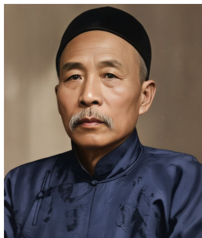
Grafika. 6-8. Od lewej, generał Liu Yong Fu, znak chiński Ling (令) umieszczany na flagach „Armi Czarnej Flagi”, oraz prezydent Republiki Formozy generał Tang Jing Song

Za dynastii Qing pracował jeszcze w jej administracji. Uchodził za skutecznego pogromcę uzbrojonych grup, oraz mediatora w konfliktach klanowych, które stanowiły zmorę południowo-chińskiej społeczności tamtych czasów. Przeżył dynastię Qing, która upadła w 1912 roku w wyniku krótkotrwałej Rewolucji Xinhai (辛亥革命) i w okres Republiki Chińskiej wszedł już jako emeryt. Żył wspomnieniami, które potem zostały spisane.