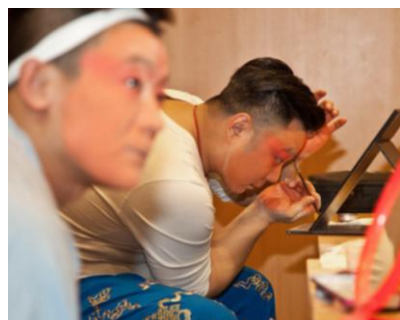
Fot.2. Aktorzy podczas przygotowań

Chiński Nowy Rok, zwany także Świętem Wiosny, jest najważniejszym i najradośniejszym świętem w Państwie Środka, które co roku witane jest tradycyjnym tańcem lwa i hukami fajerwerków. Na czas świętowania, Chińczycy dekorują swoje domy czerwonymi lampionami, ozdobami wycinanymi z papieru, natomiast przy drzwiach wieszają czerwone zwoje, na których kaligrafuje się sentencje mające przyciągnąć do domów dobrobyt, bogactwo i szczęście. Jednym słowem, chińskie ulice toną wtedy w czerwieni. Dlatego też śmiechu, radości, czerwonego koloru oraz tańca lwa nie mogło zabraknąć w trakcie obchodów tego święta w Instytucie Konfucjusza (IK) w Krakowie.