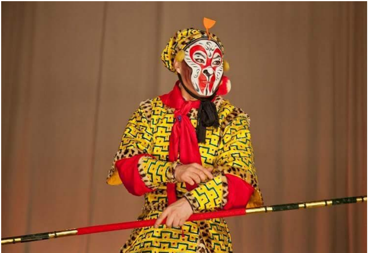
Fot.5. Sztuka pt. „Awantura w Niebiańskim Pałacu”

Podczas drugiego dnia obchodów (21 stycznia) w siedzibie Instytutu Konfucjusza przy ul. Radziwiłłowskiej 4 odbyły się liczne wykłady, slajdowiska oraz inne atrakcyjne spotkania z chińską kulturą. Najmłodszy mogli dołączyć do wspólnej zabawy w trakcie „poranka z pandą”, cyklicznego wydarzenia organizowanego przez IK oraz spróbować swoich sił w sztukach walki w trakcie warsztatów z centrum chińskich sztuk walki Choy Lee Fut.