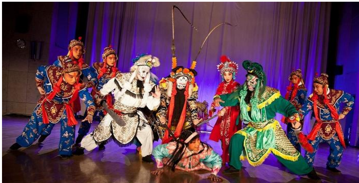
Fot.1. Opera pekińska, przedstawienie w Krakowie

Chiński Nowy Rok, zwany także Świętem Wiosny, jest najważniejszym i najradośniejszym świętem w Państwie Środka, które co roku witane jest tradycyjnym tańcem lwa i hukami fajerwerków. Na czas świętowania, Chińczycy dekorują swoje domy czerwonymi lampionami, ozdobami wycinanymi z papieru, natomiast przy drzwiach wieszają czerwone zwoje, na których kaligrafuje się sentencje mające przyciągnąć do domów dobrobyt, bogactwo i szczęście. Jednym słowem, chińskie ulice toną wtedy w czerwieni. Dlatego też śmiechu, radości, czerwonego koloru oraz tańca lwa nie mogło zabraknąć w trakcie obchodów tego święta w Instytucie Konfucjusza (IK) w Krakowie.