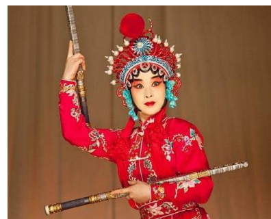
Fot.4. Ujęcie z przedstawienia