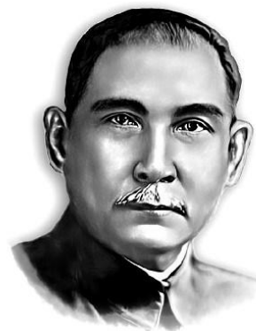
Sun Yat Sen