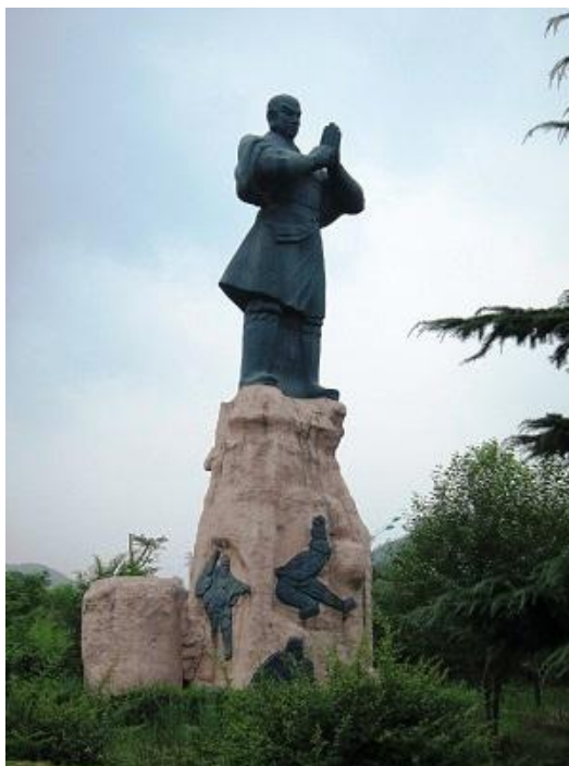
Fot. 1. Pomnik shaolińskiego mnicha usytuowany w odległości kilku kilometrów od klasztoru Shaolin

Informacje, uwagi oraz zalecenia shaolińskich mnichów dotyczące ich praktyk religijnych oraz ćwiczeń qigong