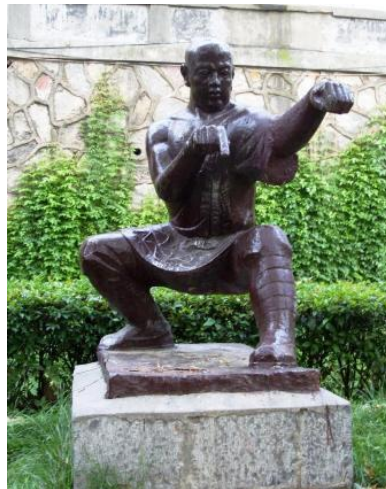
Fot. 2. Usytuowana na terenie Shaolin Wushu Guan figura shaolińskiego mnicha w postawie walki w Stylu Modliszki (fot. autor, 2000).

Na przestrzeni lat w ramach Styl Modliszki stworzono wiele form bokerskich. Jego praktycy wykorzystują w walce siłę fizyczną, wewnętrzną moc, zręczność, szybkość, a także łączą twardość z elastycznością oraz jednoczesność ataku i obrony. W trakcie walki sprawnie przechwytyją akcje przeciwnika, uwalniają się z chwytów oraz stosują nieustanną zmienność działań. Stylista z reguły nie atakuje pierwszy, lecz gdy zostanie sprowokowany do ataku, czyni to gwałtownie i błyskawicznie przywiązując dużą uwagę do uważnego postrzegania, szybkiej i skoordynowanej pracy rąk, stóp oraz ciała oraz do szybkości, zwinności i stabilności a także właściwego i starannego wyboru ruchów.