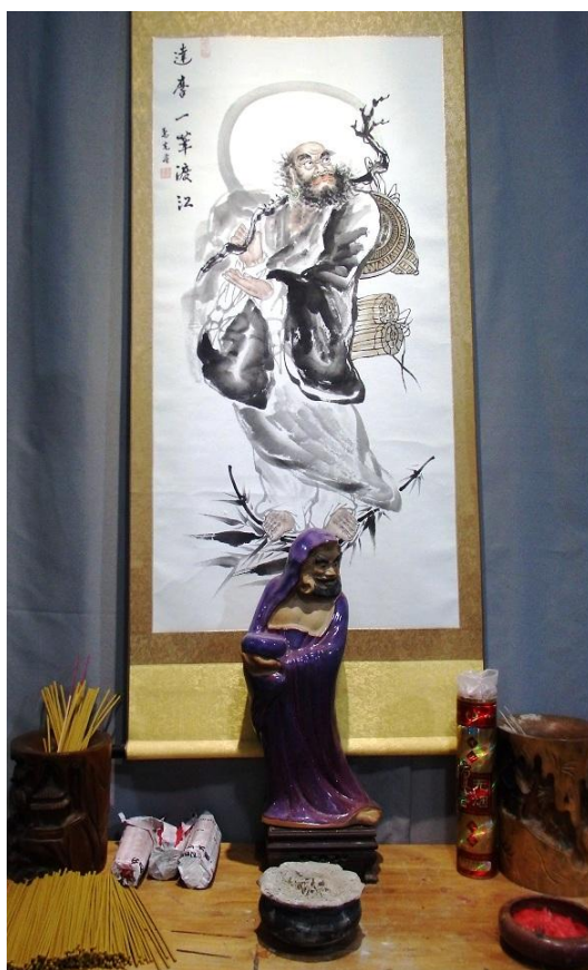
fot.1: Ołtarzyk ku czci Bodhidharmy na terenie klasztoru Shaolin.