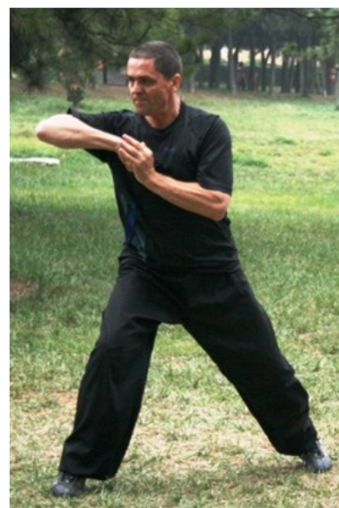
Fot. Sławomir Pawłowski sifu. Chiny, Shaolin, 2014r.