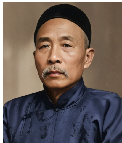
Grafika. 6-8. Od lewej, generał Liu Yong Fu, znak chiński Ling (令) umieszczany na flagach „Armi Czarnej Flagi”, oraz prezydent Republiki Formozy generał Tang Jing Song

Za dynastii Qing pracował jeszcze w jej administracji. Uchodził za skutecznego pogromcę uzbrojonych grup, oraz mediatora w konfliktach klanowych, które stanowiły zmorę południowo-chińskiej społeczności tamtych czasów. Przeżył dynastię Qing, która upadła w 1912 roku w wyniku krótkotrwałej Rewolucji Xinhai (辛亥革命) i w okres Republiki Chińskiej wszedł już jako emeryt. Żył wspomnieniami, które potem zostały spisane.